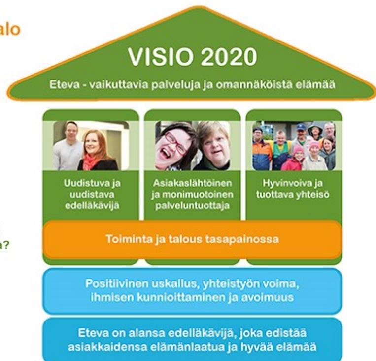
Kuva 1. Etevan strategiatalo